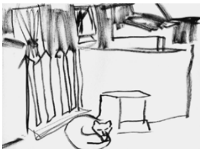
La Ciotat - 69