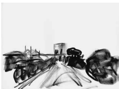
La Ciotat - 55