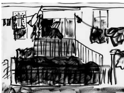
La Ciotat - 04