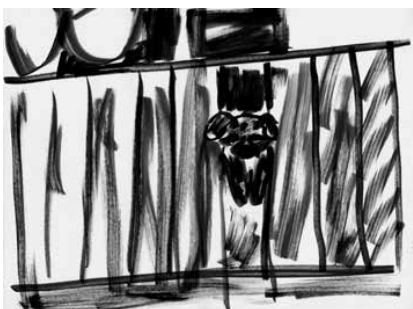
La Ciotat - 9