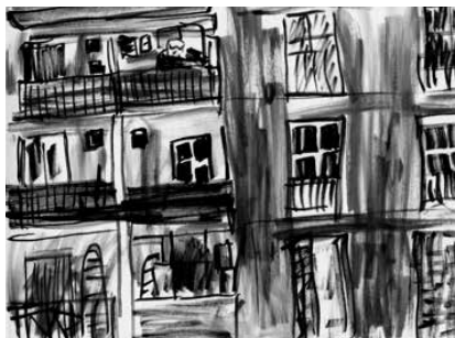
La Ciotat - 18

BON DE COMMANDE / BON DE SOUSCRIPTION page 3/7