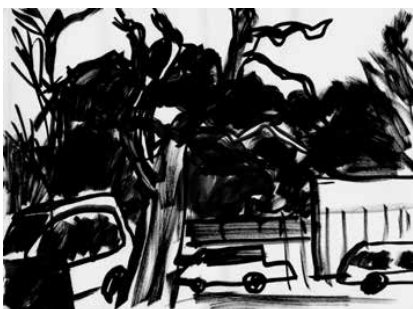
La Ciotat - 8