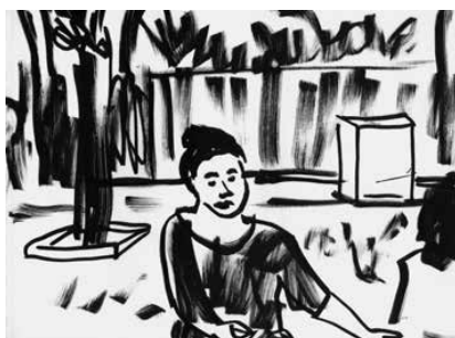
La Ciotat - 86

Distribution France, Belgique, Suisse, Luxembourg : Les Presses du réel Distribution internationale : Idea Books idea@ideabooks.nl / www.ideabooks.nl