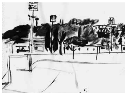
La Ciotat - 32