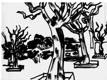
La Ciotat - 27