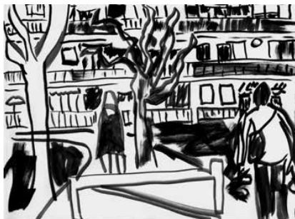
La Ciotat - 07

BON DE COMMANDE / BON DE SOUSCRIPTION page 2/7