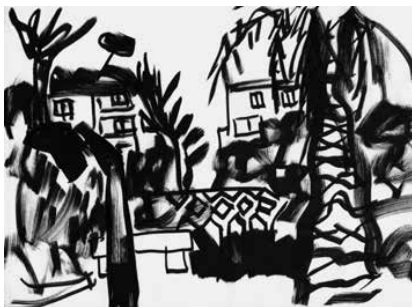
La Ciotat - 81

BON DE COMMANDE / BON DE SOUSCRIPTION page 6/7