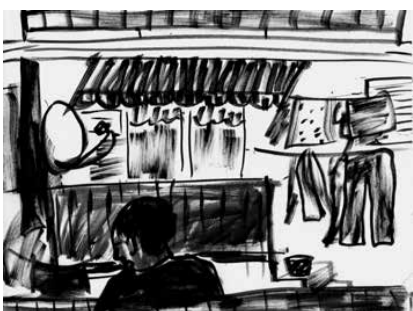
La Ciotat - 10

Distribution France, Belgique, Suisse, Luxembourg : Les Presses du réel Distribution internationale : Idea Books idea@ideabooks.nl / www.ideabooks.nl