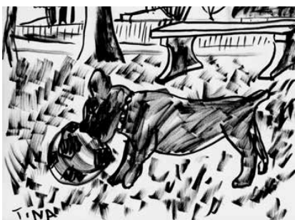
La Ciotat - 17