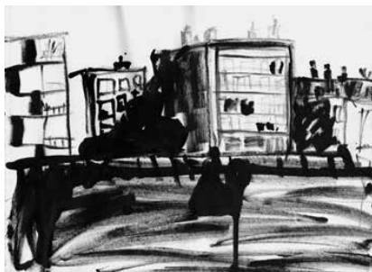
La Ciotat - 31

BON DE COMMANDE / BON DE SOUSCRIPTION page 4/7