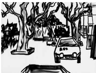
La Ciotat - 01

Distribution France, Belgique, Suisse, Luxembourg : Les Presses du réel Distribution internationale : Idea Books idea@ideabooks.nl / www.ideabooks.nl