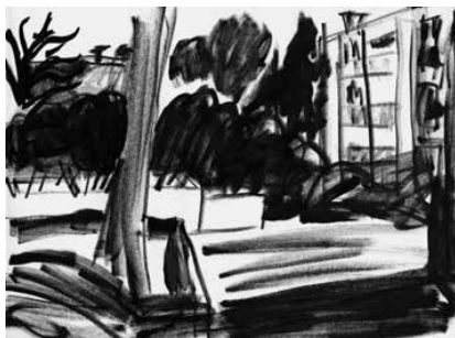
La Ciotat - 47

BON DE COMMANDE / BON DE SOUSCRIPTION page 5/7