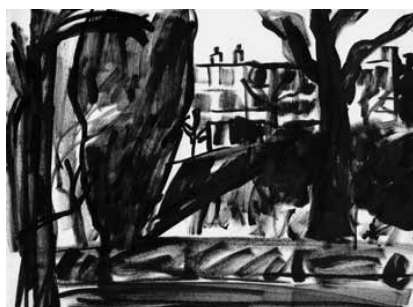
La Ciotat - 46