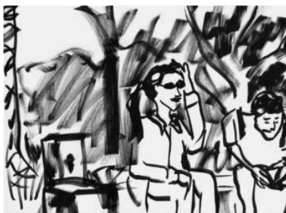
La Ciotat - 82