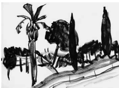
La Ciotat - 52