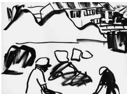
La Ciotat - 60

Distribution France, Belgique, Suisse, Luxembourg : Les Presses du réel Distribution internationale : Idea Books idea@ideabooks.nl / www.ideabooks.nl