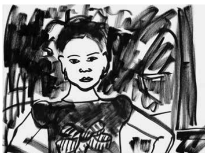
La Ciotat - 92