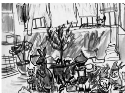
La Ciotat - 23