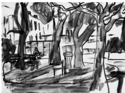
La Ciotat - 19