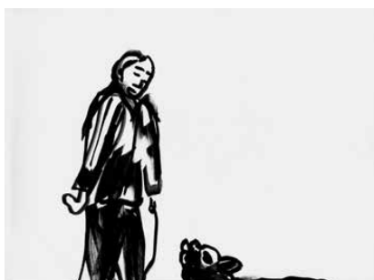
La Ciotat - 24

Distribution France, Belgique, Suisse, Luxembourg : Les Presses du réel Distribution internationale : Idea Books idea@ideabooks.nl / www.ideabooks.nl