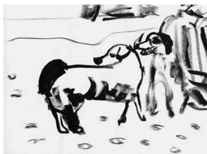
La Ciotat - 36